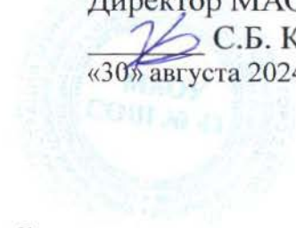
График работы кабинета ПДД на 2024 — 2025 учебный год